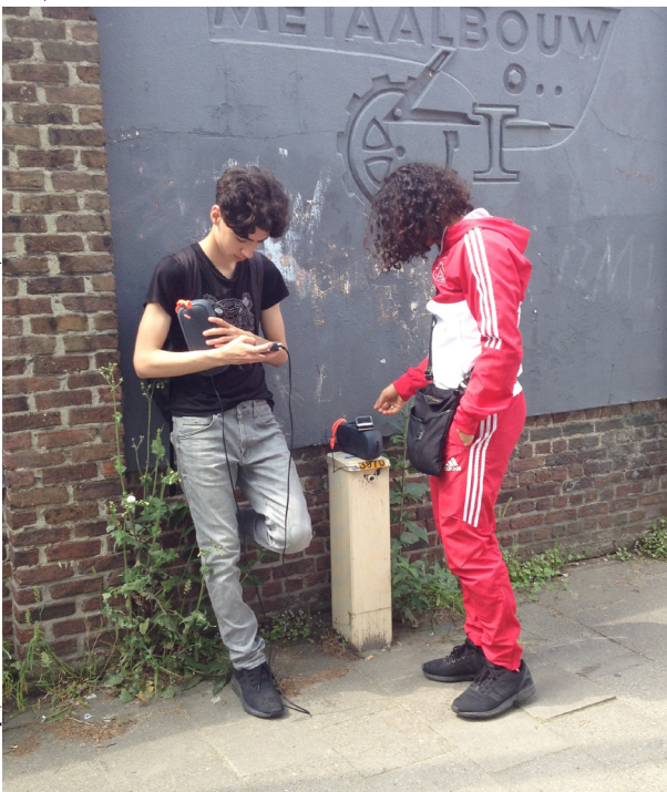
Zeemeeuwen in Gent? De leerlingen van KTA MoBi 'hacken' de buurt rond hun school met geluiden die ze opnamen aan zee.