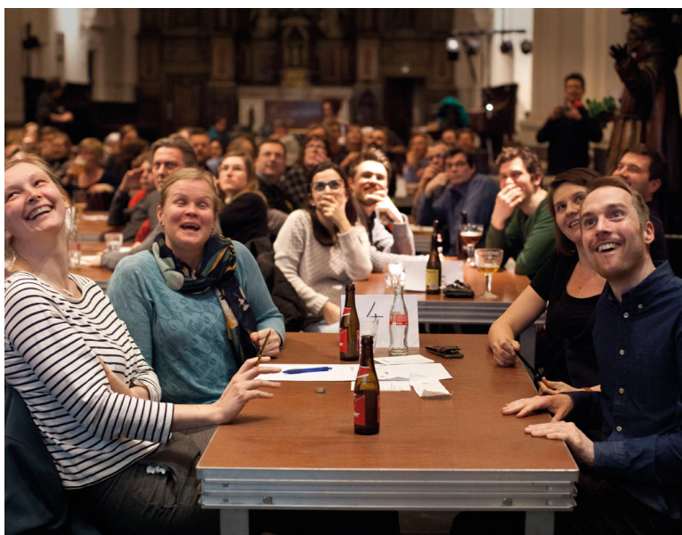
Klinkt Als Quiz

Al die geluiden uit de buurt, koppelden we weer terug naar de bewoners in De Klinkt Als Quiz: een originele, toegankelijke en geestige familiequiz vol weetjes en anekdotes over geluid en alles wat er (van dichtbij of van heel ver) mee te maken heeft. Een volle zaal brak zich het hoofd over vragen als: wat is een ander woord voor 'klanknabootsing' of wie componeerde het werkstuk 4'33" dat bestaat uit 4 minuten en 33 seconden stilte? In de verschillende vragen zaten uiteraard regelmatig opnames uit of een knipoog naar de Papegaaivijk!