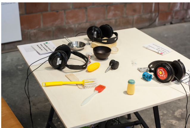
Expo rond geluid door de blinden en slechtzienenden van het Sint-Rafaël Revalidatiecentrum