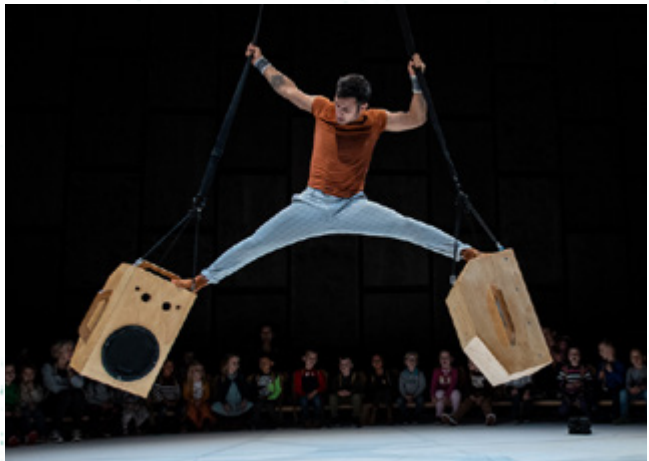
Geluidsacrobatie in de voorstelling Murmur

Luisteren is fysiek. aifoon maakt van geluidskunst luisterkunst. Dat betekent dat niet de virtuositeit van een sound designer centraal staat, maar de vraag wat die sound doet. Geluid is voor aifoon een gebeurtenis die zich ontrolt in tijd en ruimte. In de circustheatervoorstelling murmur (2019, een coproductie met het gezelschap Grensgeval) ging een acrobaat het duet aan met een ronddraaiende speaker én met de speakers die in de rugzakken van de toeschouwers verborgen zaten. Een geluidscompositie werd een luisterchoreografie: het geluid zelf danste. De Zwerm , het mobiele en modulaire audiosysteem dat de speakers met elkaar verbond werd door aifoon speciaal voor deze voorstelling ontworpen, en zal in de komende jaren verder ingezet worden als artistieke tool.